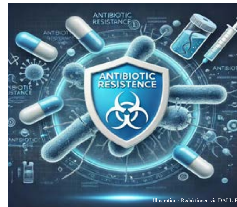
Illustration: Redaktionen via DALL-E

Ett av de största problemen är bristen på incitament för läkemedelsbolagen att satsa på nya antibiotika. Eftersom dessa läkemedel oftast används som sista utväg och bara under en kort tid, är de inte lika lönsamma som andra typer av läkemedel. För att motverka