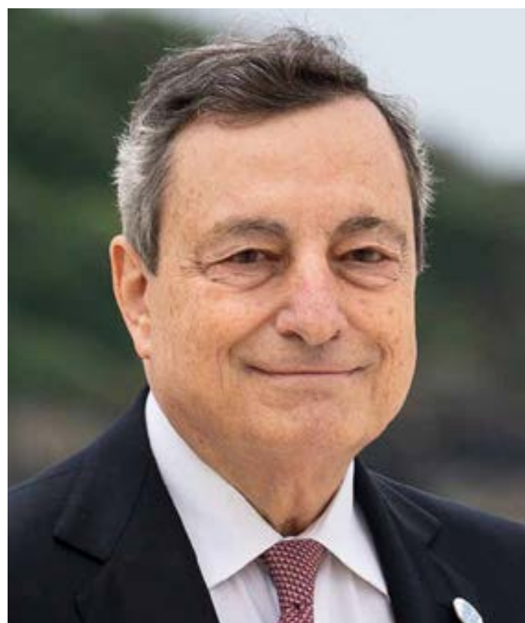
Foto: Mario Draghi, 2021.

Samtidigt har EU-kommissionären Margrethe Vestager fortsatt sin kamp mot stora teknikföretag som Google och Apple, med en strategi som fokuserar