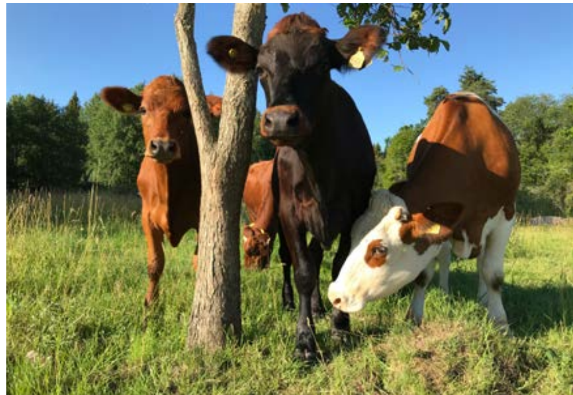
Koslem kan hjälpa diskbräckspatienter efter operation.

Forskare vid Uppsala universitet har tagit fram en gel inspirerad av koslem för patienter som lider av diskbräck. Genom att tillsätta mucingel direkt efter en operation kan man skapa en skyddande barriär runt diskarna, som hindrar immunförsvaret från att angripa deras kärna. På så sätt hålls diskarna intakta och risken för ytterligare skador minskar.