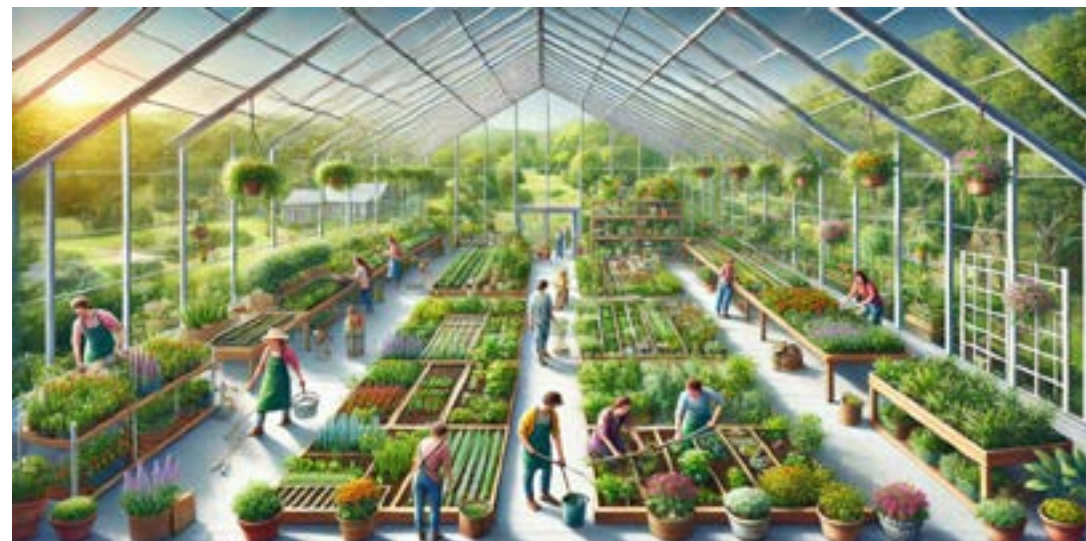
Illustration av ett hållbart samhällsprojekt i ett växthus där människor arbetar tillsammans för att främja miljömedvetenhet och hållbarhet. Illustration: Redaktionen via DALL-E

Lunds kommun erbjuder nu föreningar och organisationer möjligheten att ansöka om miljöanslag för att stödja projekt som bidrar till en mer hållbar utveckling. Syftet med anslaget är att uppmuntra föreningslivet att ta initiativ som gynnar miljön och skapar positiva förändringar i samhället.