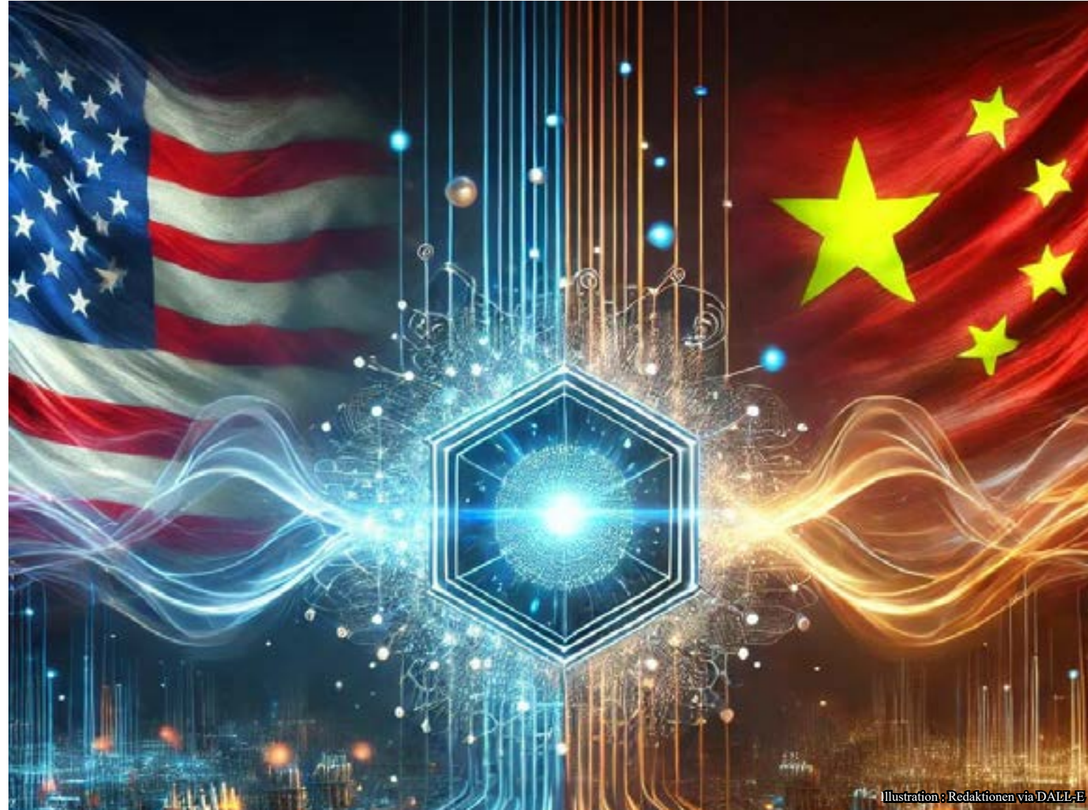
Illustration: Redaktionen via DALL-E

USA, Kina och EU är inblandade i en enorm forskningssatsning som kan leda till betydande teknologisk utveckling i framtiden: kvantdatorer.