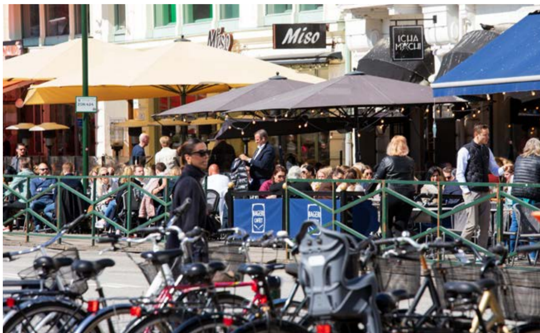
Trots fortsatt hög inflation, stigande räntor och fallande reallöner, sjunker arbetslösheten fortfarande i Sverige och Skåne. Samtidigt är läget väldigt tufft för bygg- och detaljhandelsbranschen.

ARBETSMARKNAD Hög inflation, högre räntor och fallande reallöner men ännu ingen kris som på 1990-talet eller under finanskrisen 2008. Sedan september 2020 har månadskostnaden för en tvåbarnsfamilj med bil och villa ökat med 9 100 kronor. De fallande reallönerna pressar bostadspriserna och konsumtionsutrymmet vilket gör att sällanköpsvaruhandeln och byggindustrin har det extra kämpigt. Förra år minskade antalet påbörjade nya bostäder i Skåne med 40 procent. Orderingången i verkstadsindustrin utgör en ljusglimt tillsammans med den fortsatt fallande arbetslösheten. Den svaga svenska kronan gör samtidigt att skånsk ekonomi får stöd av det ökande antal danskar som kommer hit för att handla eller turista. Till skillnad från i Sverige väntas den danska ekonomin fortsätta att växa i år. Det visar rapporten Skånsk konjunktur som Øresundsinstitutet gjort på uppdrag av Sparbanken Skåne.