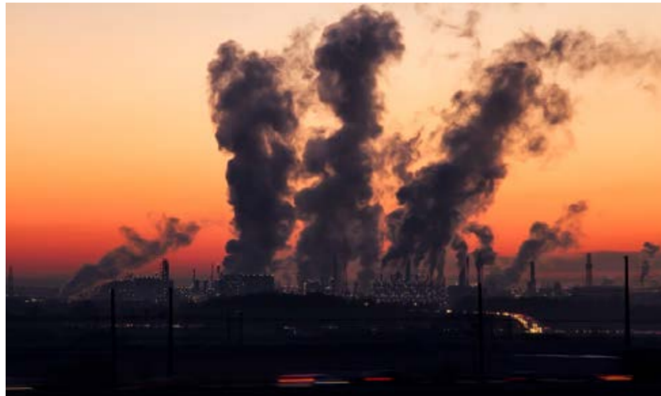
Oljebolagens nya strategi att satsa på plast, konstgödsel och kemikalier ökar klimatutsläppen och gör det mycket svårt för biobaserade eller återvunna alternativ att slå igenom.

I takt med att marknaden för fossila bränslen sviktar storsatsar oljeindustrin på kemi- och plastindustrin i stället. Strategin tycks fungera: plastindustrin växer snabbare än den globala ekonomin. Mångmiljardbidrag från stater i Europa och USA liksom offentligt finansierade banker, i kombination med svag lagstiftning, pekas ut som orsaker till den snabba tillväxten. Även svenska exportkreditnämnden har bidragit. Detta framkommer i en ny rapport som släpps idag.