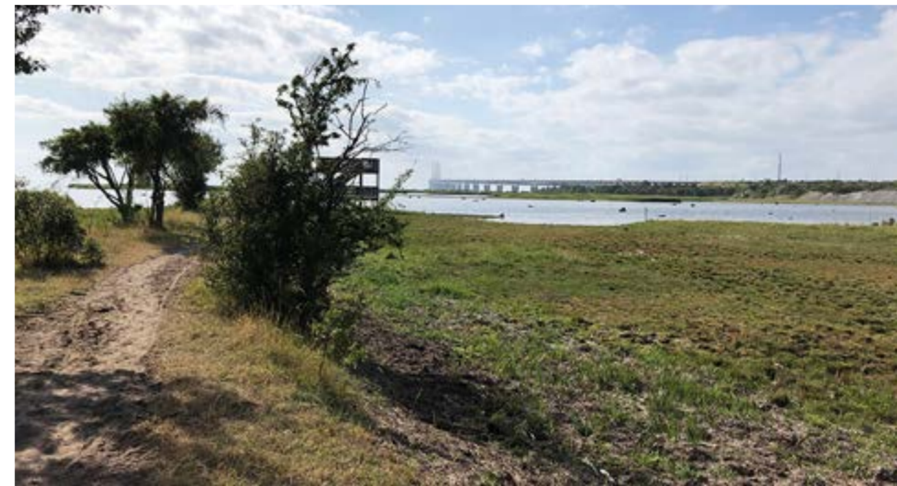
Bunkeflo strandängar.

■ Naturreservatet Bunkeflo strandängar borde utökas och få tydligare bestämmelser, menar stadsbyggnadsnämnden. Därför gav nämnden på onsdagen (den 24 maj) grönt ljus för att detta ska undersökas.