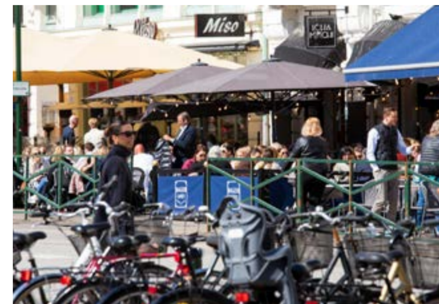
Trots fortsatt hög inflation, stigande räntor och fallande reallöner, sjunker arbetslösheten fortfarande i Sverige och Skåne. Samtidigt är läget väldigt tufft för bygg- och detaljhandelsbranschen.

ARBETSMARKNAD Hög inflation, högre räntor och fallande reallöner men ännu ingen kris som på 1990-talet eller under finanskrisen 2008. Sedan september 2020 har månadskostnaden för en tvåbarnsfamilj med bil och villa ökat med 9 100 kronor. De fallande reallönerna pressar bostadspriserna och konsumtionsutrymmet vilket gör att sällanköpsvaruhandeln och byggindustrin har det extra kämpigt. Förra år minskade antalet påbörjade nya bostäder i Skåne med 40 procent. Ordergången i verkstadsindustrin utgör en ljusglimt tillsammans med den fortsatt fallande arbetslösheten. Den svaga svenska kronan gör samtidigt att skånsk ekonomi får stöd av det ökande antal danskar som kommer hit för att handla eller turista. Till skillnad från i Sverige väntas den danska ekonomin fortsätta att växa i år. Det visar rapporten Skånsk konjunktur som ÖresundsInstitutet gjort på uppdrag av Sparbanken Skåne.