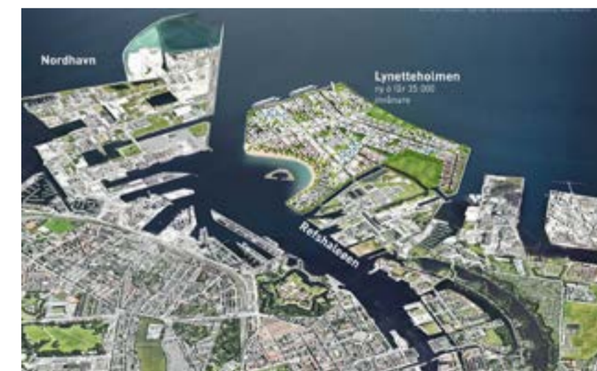
Sex svenska myndigheter kräver i ett brev svar från den danska miljöstyrelsen för hur blockeringen av genomströmningen i Öresund ska kompenseras. Kartor: Transport-, Byggnings- och Boligginisteriet. Bildmontage: News Öresund

De svenska myndigheterna noterar i sitt brev att andra Öresundsprojekt är betingade av en så kallad "nollösning", som lämnar vattengenomströmningen oförändrad, något de menar ska gälla Lynetteholmen också.