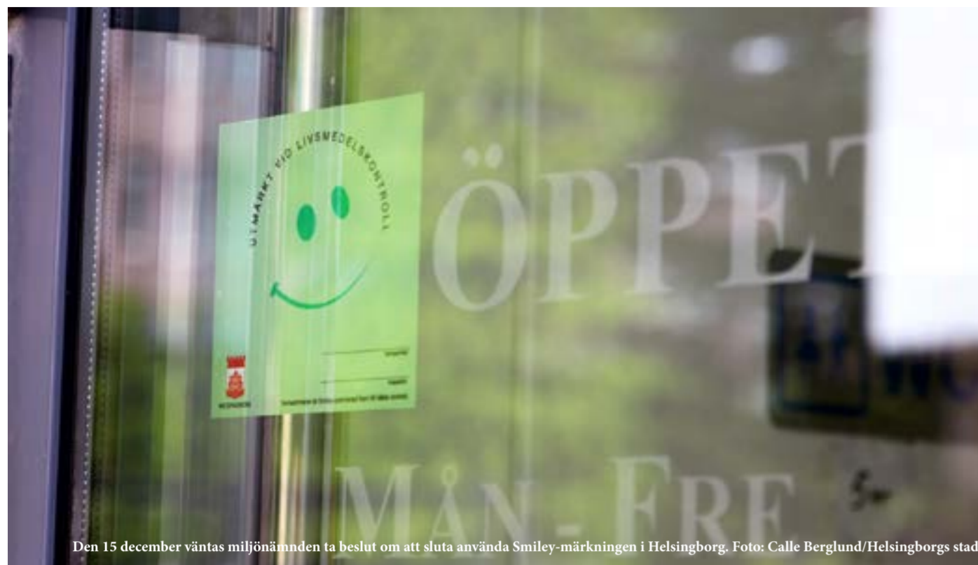
Den 15 december väntas miljönämnden ta beslut om att sluta använda Smiley-märkningen i Helsingborg.

■ Miljönämnden väntas ta beslut om att sluta använda systemet med Smiley-märkningen i Helsingborg. Beslutet tas under miljönämndens sammanträde 15 december. Märkningen har inte haft tillräcklig effekt och kan inte användas parallellt med Livsmedelsverkets nya riskklassningsmodell som börjar gälla 1 januari 2024.