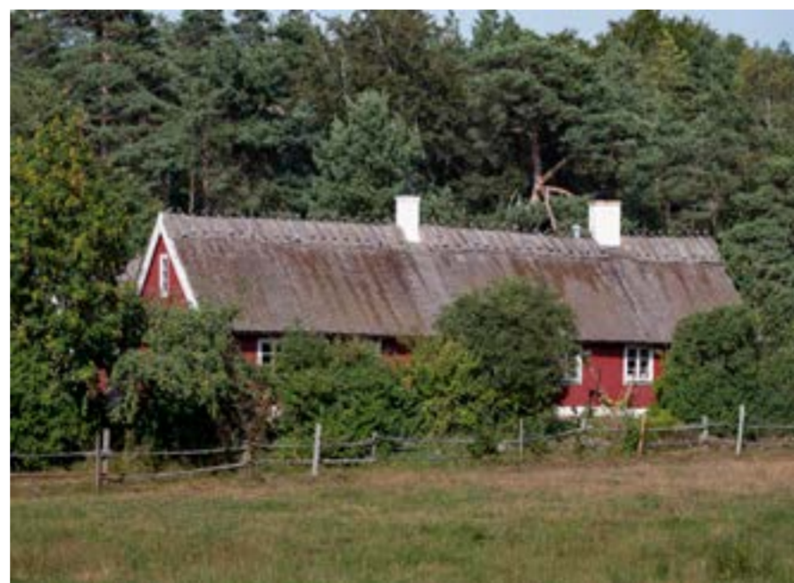
Det nya stärkta samordningsnumret ger bl.a. danska ägare av svenska fritidshus en bättre möjlighet till digitala kontakter med myndigheter och företag.

– Jeg forventer, at vi med de nye regler kan få løst mange af de praktiske problemer vores fritidshusejere har, fordi danskere hidtil ikke har kunnet få et svensk BankID. Det har givet store udfordringer i forhold til almin-