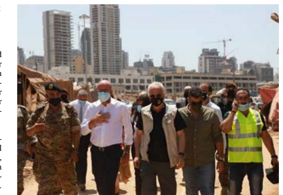
Mr Charles MICHEL, President of the European Council.

Under sitt besök träffade Charles Michel president Michel Aoun, parlamentets talman Nabih Berri och premiärminister Hassan Diab. Enheten och stabiliteten i Libanon är idag viktigare än någonsin, både för landet och för hela regionen. Charles Michel betonade också vikten av strukturreformer som är i linje med regeringens reformplan och Libanons internationella åtaganden och som den libanesiska be-