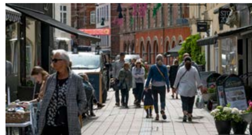
Svenskar spenderar 400 miljoner danska kronor - mer än en halv miljard svenska kronor - i Helsingør varje år, enligt föreningen Helsingør Handel.

■ När gränsen till Danmark återigen öppnade för skåningarna i mitten av juli välkomnades svenskarna varmt av näringslivet i Helsingør.