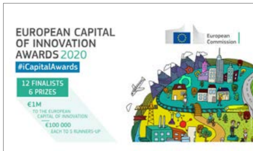
Helsingborg är en av finalisterna i European Capital of Innovation Awards 2020

■ Helsingborg är en av finalisterna i European Capital of Innovation Awards 2020, även känd som iCapital. Det är ett årligt pris som tilldelas den europeiska stad som bäst kan visa sin förmåga att utnyttja innovation för att förbättra invånarnas livskvalitet. Staden delar finalplats med städer som Wien, Milano och Valencia.