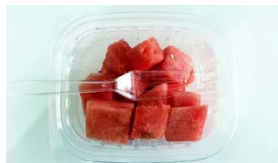
En ny utredning från regeringen föreslår att engångsförpackningar i plast beskattas. Förslaget innebär att mat och dryck för avhämning kan bli dyrare: fem kronor mer för dryck i plastmugg och sju kronor mer för mat i plastförpackning.

skynda godkännande av och tillgång till verkningfulla vacciner mot covid-19. I detta ingår ett påskyndat godkännandeförfarande samt flexibilitet i fråga om märkning och förpackning. Eftersom investeringar i covid-19-vacciner är dyra och ofta kan misslyckas är det ett högriskbeslut för vaccinutvecklarna, och överenskommelserna möjliggör därmed investeringar som annars inte skulle ha kunnat göras.