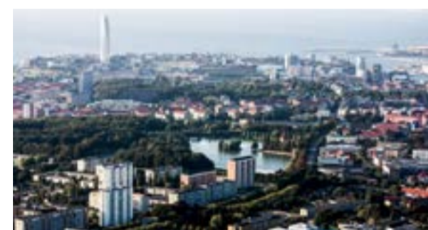
Malmö flygbild.

Tillväxt Malmö är en del av stiftelsen Uppstart Malmö och ett unikt samarbete mellan näringslivet och Malmö stad. Driftstödet från Malmö stad matchas av minst lika mycket privat riskkapital och pro bono-tid från Tillväxt Malmös partners. På så sätt är erbjudandet kostnadsfritt för företagen. Inför fortsättningen av verksamheten vill Tillväxt