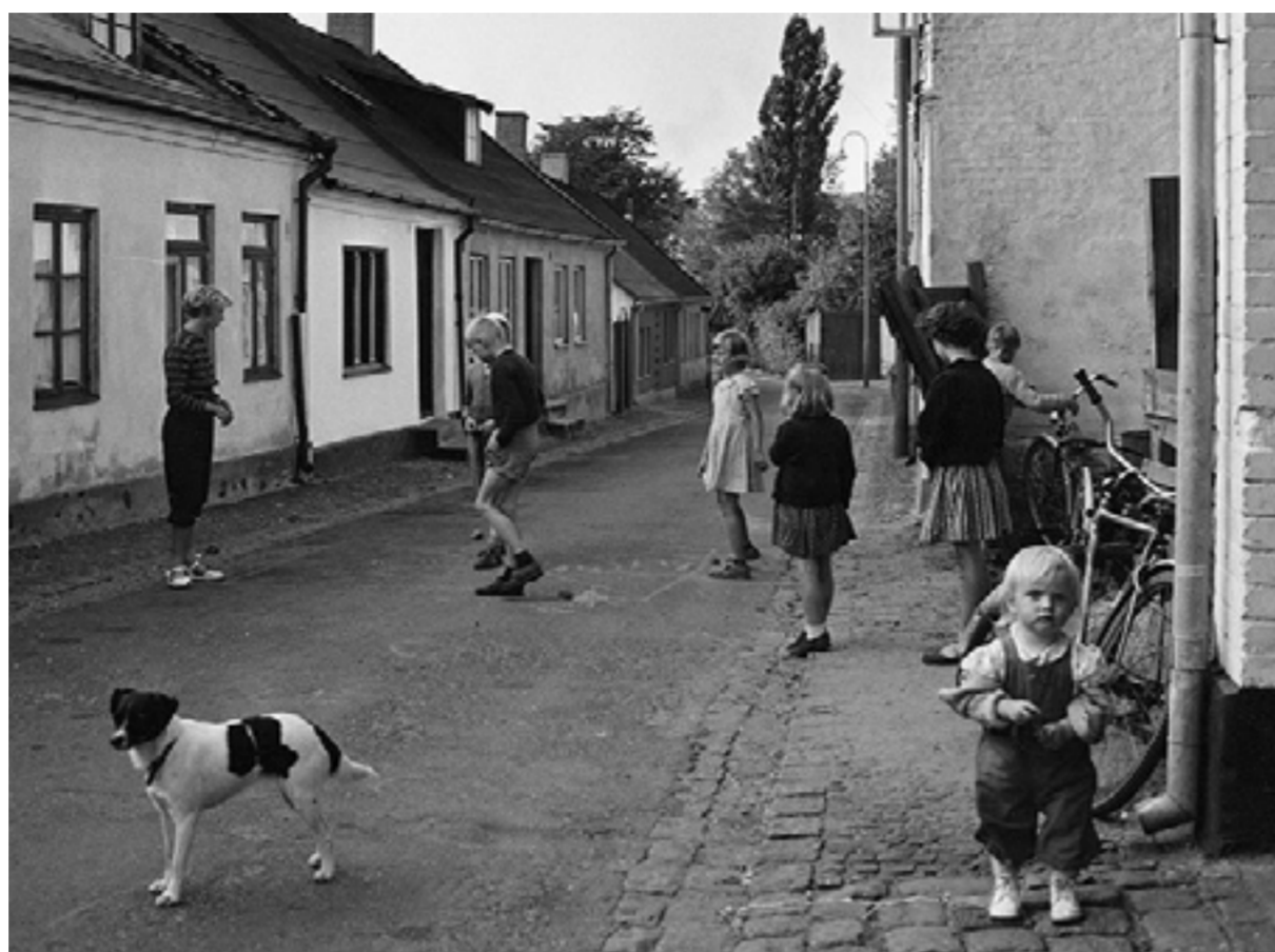
Barndomens lekkamrater och omgivning spelar roll i om du skaffar dig en högre utbildning eller ej, visar ny forskning som gått in på djupet med Landskrona. (Fotot är dock från Malmö, ca 1954.)

Klassursprung hade även ensamt en stark anknytning till utbildning: barn från över- och medelklass hade fortfarande högre chans att ta examen från en högre utbildning än barn från arbetarklass. Ett exempel på ojämlikheterna hittade forskarna bland 14-åriga flickor, där barnen från de högsta sociala klasserna som sam-