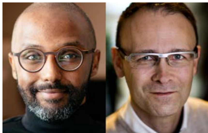
Korresponderande författarna Mohamed Ibrahim, Göteborgs universitet och Martin Bergö, Karolinska Institutet.

Kan ge effektivare behandling I ett nästa steg behandlade HGPS-celler från människa, och celler från möss med HGPS-liknande