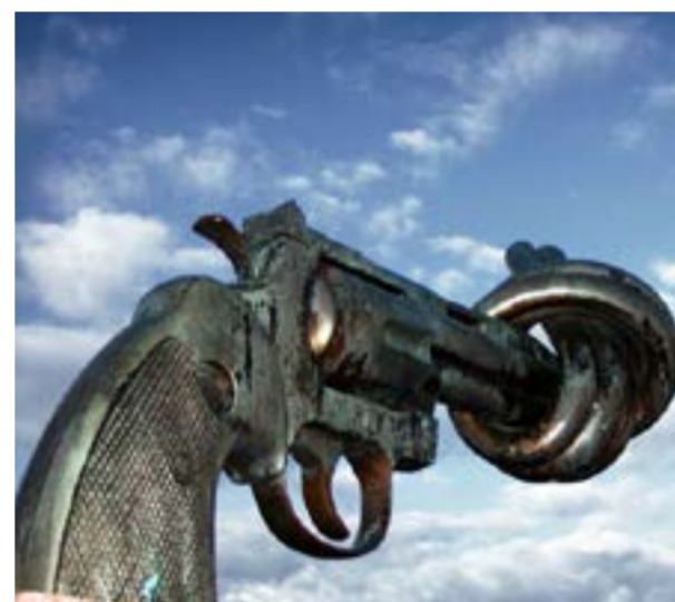
"Non-Violence" réalisé par Carl Fredrik Reuterswärd (Malmö - Suède).

Konflikter och oro medför oftast negativa konsekvenser för flickor och kvinnor i Afrika. Förutom att ibland vara tvungna att fly, kan de även utsättas för svåra förhållanden i temporära läger, som exempelvis sexuellt utnyttjande. Under en