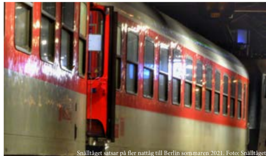
Snälltåget satsar på fler nattåg till Berlin sommaren 2021.

■ Nu släpper Snälltåget biljetterna till sina nattåg på sträckan Stockholm-Malmö-Köpenhamn-Hamburg-Berlin från slutet av mars-september 2021. Bolaget planerar fler turer än tidigare år. Under sommarmånaderna erbjuds dagliga avgångar och övrig tid två avgångar i veckan.