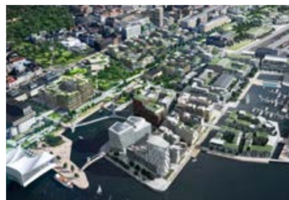
En utbyggnad av stationen och övertäckning av spåren kan ge plats för nya bostäder och kontor i centrala Helsingborg. Illustration: Helsingborg stad

Helsingborgs stad vill bygga ut Helsingborg C med två nya spår och perronger parallellt med dagens station vilket skulle innebära att stationen då skulle ha sex spår. Genom de nya spårerna kan Helsingborg C och Väst-kustbanan kopplas ihop med en framtida HH-förbindelse. I det gamla färjeläget och ge-