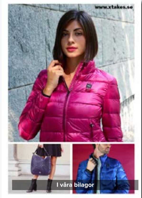
I våra bilagor

JUST NU UPP TILL 50 % RABATT PÅ VÅRA ANNONSER.