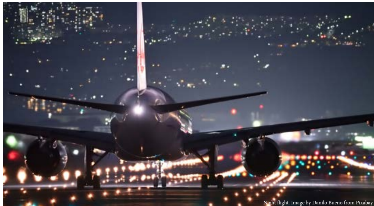
Night flight.