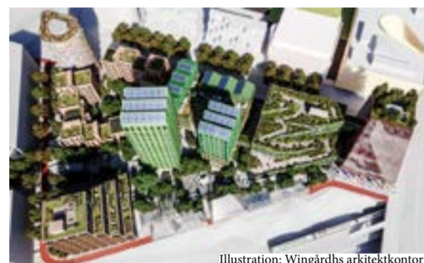
Illustration: Wingårdhs arkitektkontor

■ Den sista pusselbiten läggs nu till kvarteren runt Hyllie stationstorg med Embassy of Sharing som ska genomföras av FN:s hållbarhetsmål och Agenda 2030.