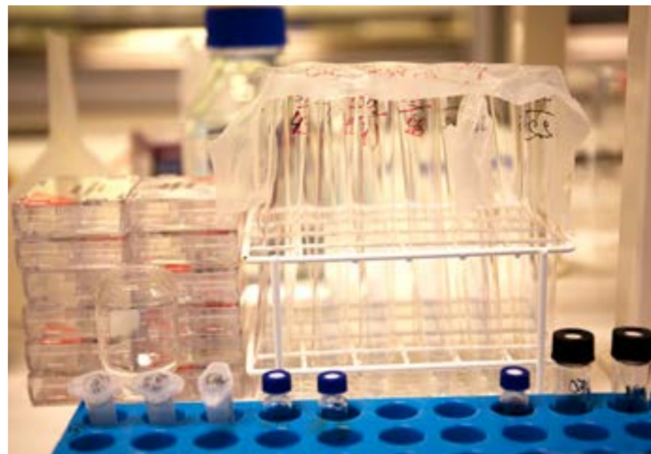
Köpenhamns flygplats undersöker möjligheten för att införa snabbtest för covid-19 för resenärer som kommer från riskländer.

■ Snabbtest för covid-19 som ger svar inom 30 minuter för alla resenärer som kommer till Danmark från land med hög smittspridning. Det kan vara räddningen för flygbranschen, uppger Köpenhamns flygplats i sin delårsrapport.