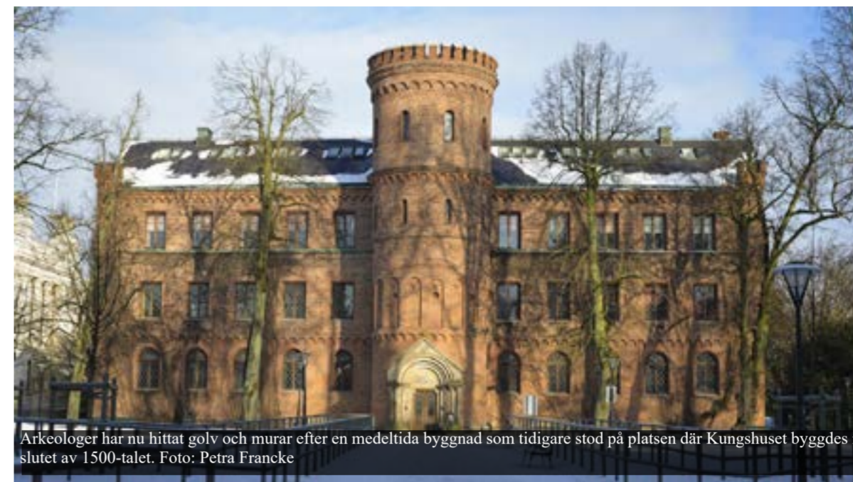
Arkeologer har nu hittat golv och murar efter en medeltida byggnad som tidigare stod på platsen där Kungshuset byggdes i slutet av 1500-talet.

■ Kungshuset stod färdigt 1584 och är en av Lunds äldsta byggnader. Vid en arkeologisk utgrävning inne i huset har tidigare okända golv och murar nu kommit i dagen. De visar att det har stått en ännu äldre byggnad på platsen – kanske en del av det medeltida ärkebiskopsresidenset i Lundagård.