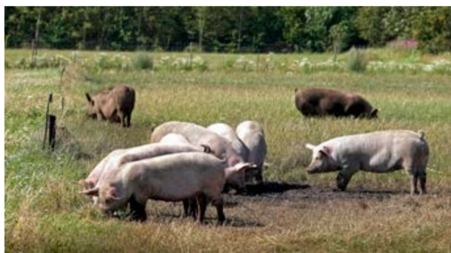
Foto: De här frigående grisarna utanför byn Tarm på Jylland räknas nu in i begreppet närproducerat när Region Skåne upphandlar livsmedel - under förutsättning att de föds upp i enlighet med svenska djur- och växtskyddslag.

■ Danska livsmedel ska jämföras med livsmedel producerade i Skåne och ytterligare sju svenska regioner i södra och västra Sverige när Region Skåne gör sina inköp. Regionstyrelsen fastställde i veckan en definition av närproducerade livsmedel där även grannlandet på andra sidan Öresund ingick. Det framgår av ett pressmeddelande.