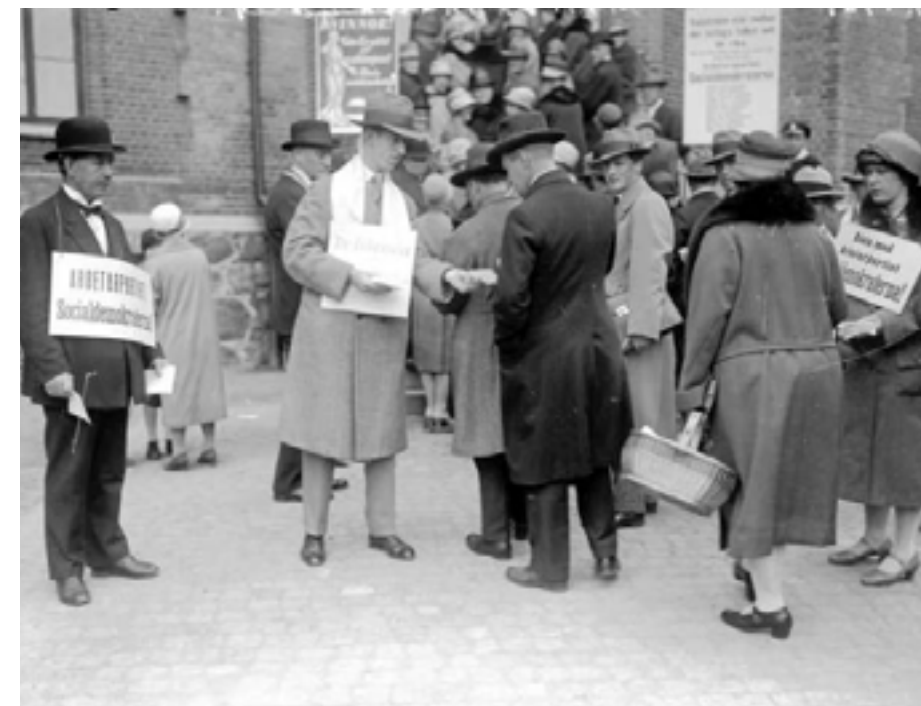
Valarbetare och väljare på valdagen den 15 september 1928 i Göteborg.

För det andra var det betydelsefullt för den demokratiska stabiliteten att ha en kombination av starka och välorganiserade politiska partier och ett starkt och organiserat civilsamhälle. Starka partier och ett starkt föreningsliv bidrog tillsammans till att kanalisera och dämpa befolkningens frustration under kriser, eftersom de fungerade som en viktig