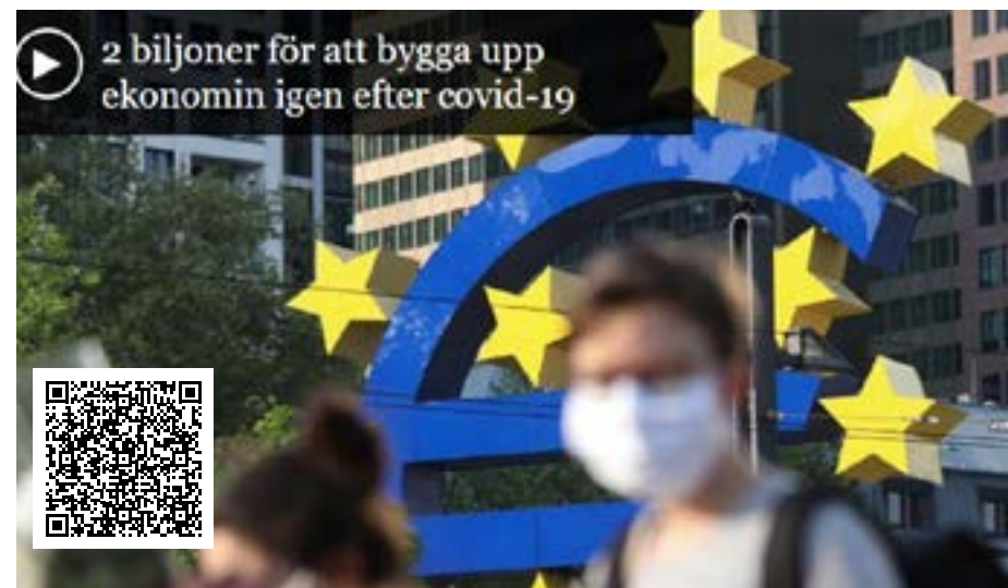
2 biljoner för att bygga upp ekonomin igen efter covid-19.

Det massiva återhämtningspaketet, som kammarerna krävde redan i den senaste resolutionen i april, måste gälla tillräckligt länge för att kunna hantera de för-