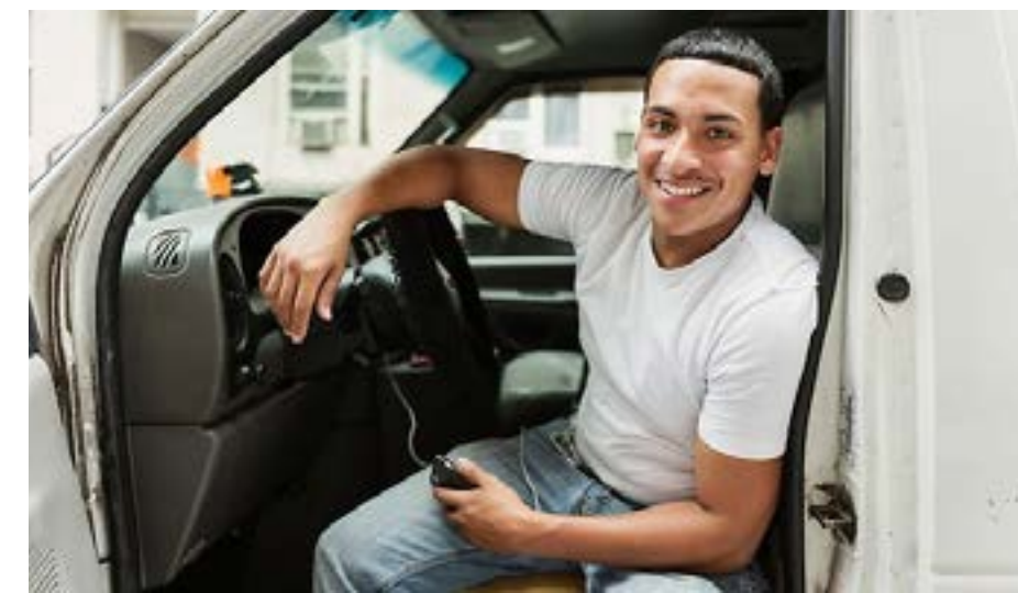
Budbilsförare är ett av flera yrken där det finns fler lediga jobb nu än för ett år sedan. Källa: Arbetsförmedlingen

Fler jobb under krisen Störst ökning av antalet lediga jobb under det senaste året har skett inom bland annat transport och kriminalvårdare.