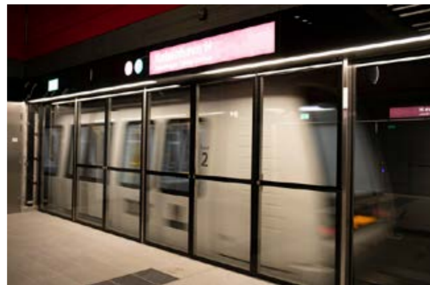
Från söndagen den 12 januari till söndagen den 26 januari 2020 kommer Cityringen i Köpenhamn att hållas stängd.