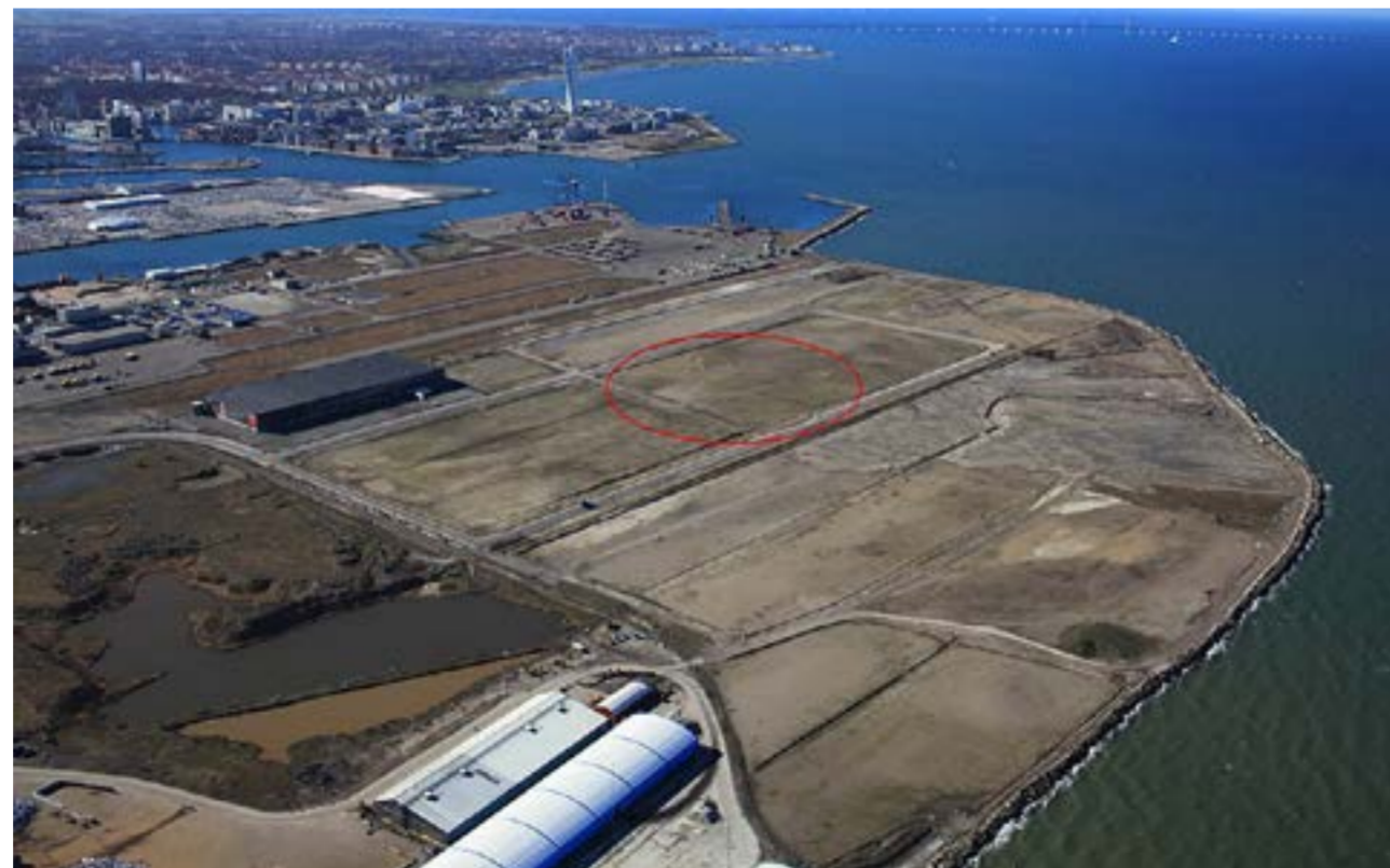
Här köper MG Real Estate mark i Norra Hamnen i Malmö.