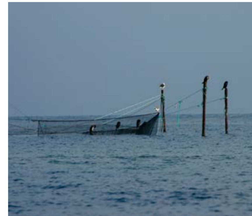
Östersjön Fiske Nätverk

Livsmedelsverkets kostråd om dioxiner och PCB i fisk Dioxiner och PCB är miljögifter som lagras i kroppen under många år och som förs över till barnet vid graviditet och amning. Barn är känsligare för dessa ämnen än vuxna, eftersom de utvecklas. Därför bör barn (både pojkar och flickor), ungdomar och