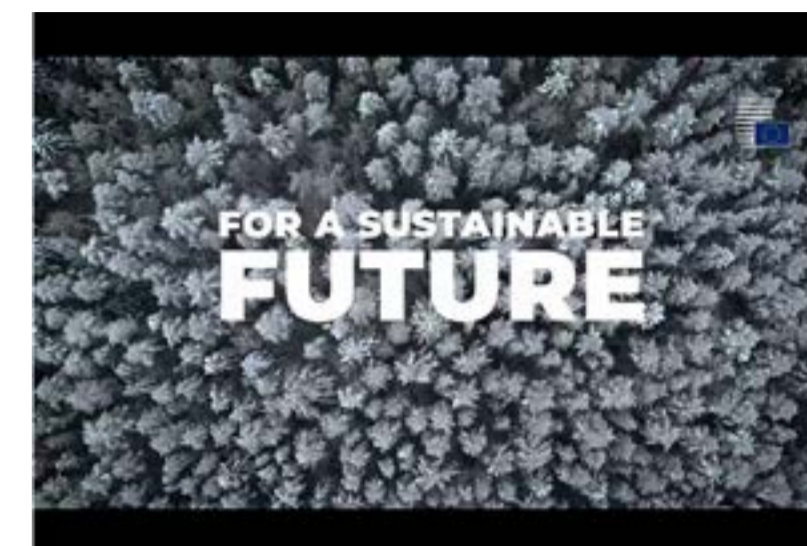
Skogarna är nyckeln till en hållbar framtid

De rekommenderar också att det för alla nya relevanta övergripande EU-handelsavtal ska föreslås särskilda bestämmelser om hållbart skogsbruk