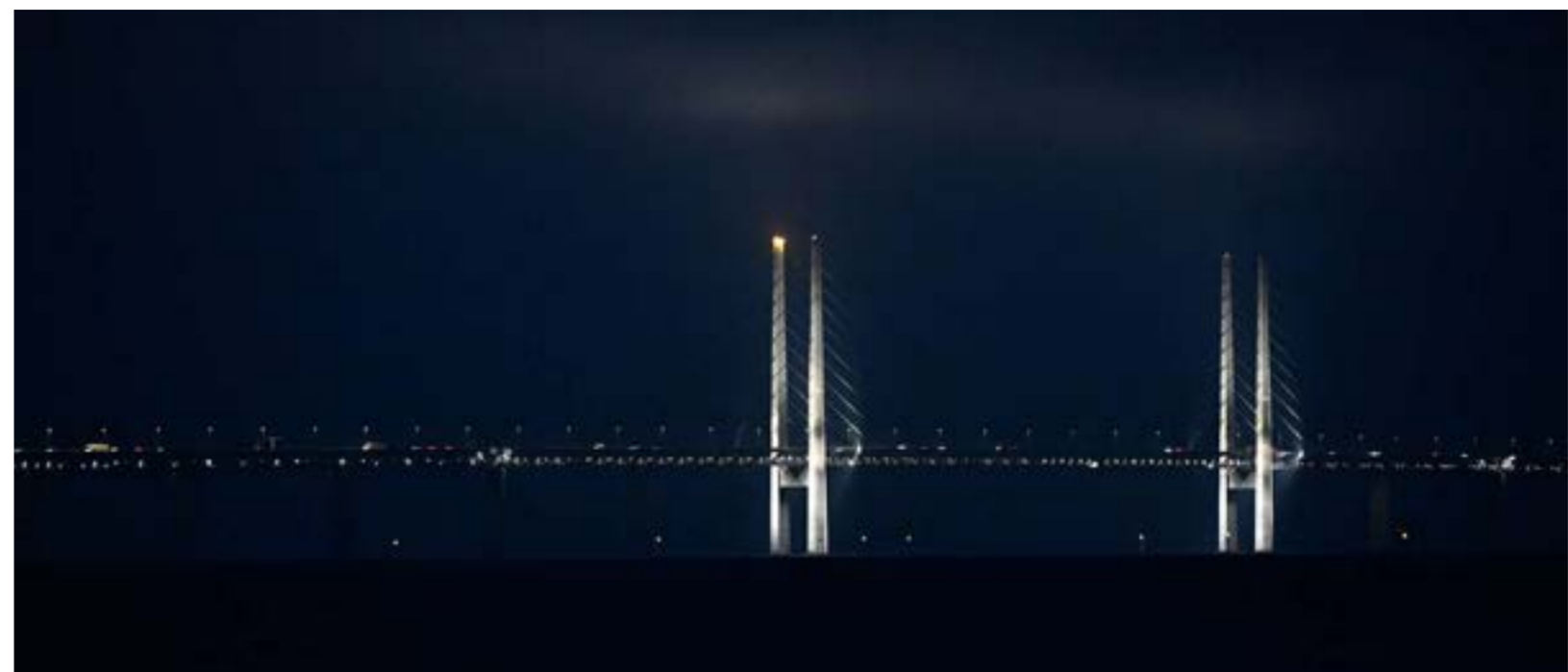
Adventsljusstaken monteras på Öresundsbron 2019.

Världens kanske högsta adventsljusstake – på toppen av Öresundsbron – tänds för tredje året i rad. Ännu mer ljus i vintermörkret blir det med hjälp av lysande julgranar i betalstationen och nödbelysningens 1800 lampor på järnvägsdäck.