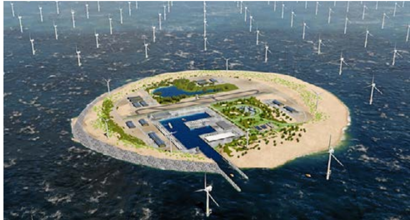
B Så här såg statliga Energinets skiss på en energiö vid Dogger Bank ut när den presenterades för två år sedan. Illustration: Energinet

Som följd av förra veckans klimat planerar den danska regeringen att bygga en eller flera stora energiöar med en kapacitet motsvarande tio stora havsbaserade vindkraftsparker och en prislapp på upp emot 300 miljarder danska kronor. Under de kommande dagarna kommer Klima, Energi- och Forsyningsministeriet att inleda upphandlingen av en förundersökning av projektet rapporterar Berlingske.