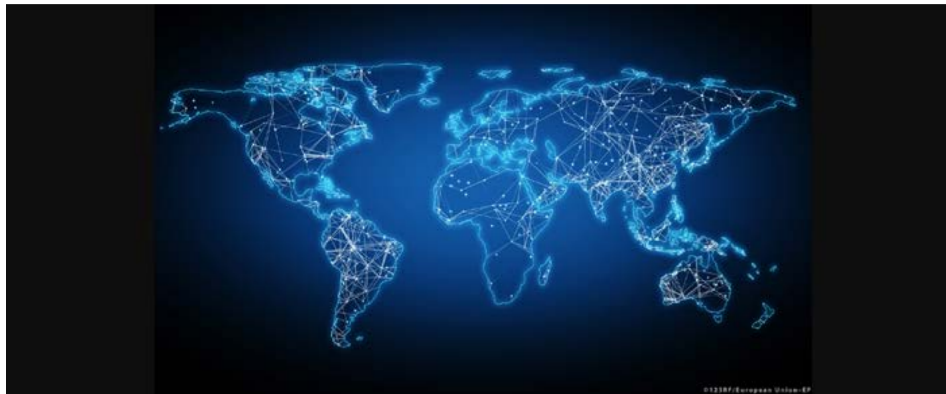
Ledamöter kräver svar om storföretags skatteflykt

Européerna förväntar sig EU-åtgärder för att garantera att multinationella företag beskattas rättvist inom EU sade ledamöterna i en plenardebatt den 16 december.