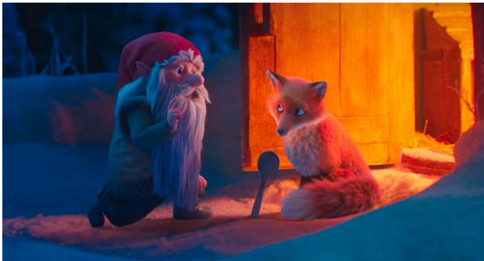
Ur filmen Räven och Tomten.