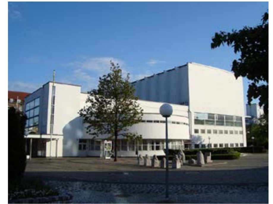
Helsingborgs konserthus.

Bakgrunden till samarbetet är de goda erfarenheter av tidigare samarbeten som bland andra kulturinstitutionen Kulturvärfvet i Helsingör och konsertarrangören The Tivoli i Helsingborg gjort under de senaste två åren: Tio danska band, däribland Nephew, har spelat konserter i Helsingborg, och tolv svenska band, däribland Mando Diao, har spelat i Helsingör. Läg