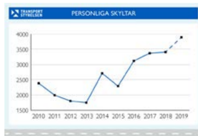
2019 är ett nytt rekordår för personliga registreringsskyltar.