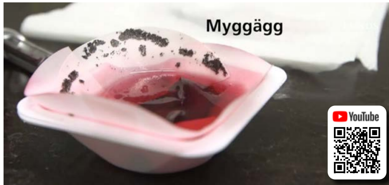
Rödbetor stoppar mygg.

Forskare från Sverige och USA har upptäckt ett ämne i rödbetsskal som är mycket effektivt för att bekämpa mygg. Ämnet, geosmin, är extremt dyrt och svårt att få tag på. Upptäckten ändrar på det.