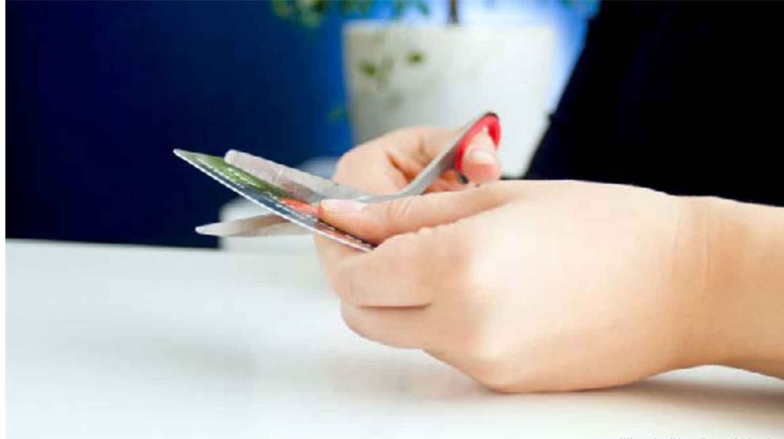
Klipper kreditkort.

Intresset för skuldsanering är större än någonsin, visar nya siffror. Aldrig tidigare har så många personer ansökt om skuldsanering som under årets första sex månader.